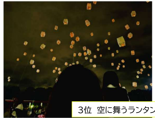
3位 空に舞うランタン