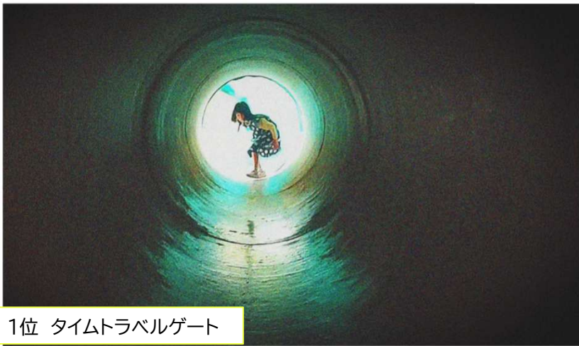
1位 タイムトラベルゲート